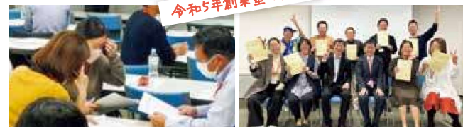
※プライバシー保護のため一部画像を加工しております