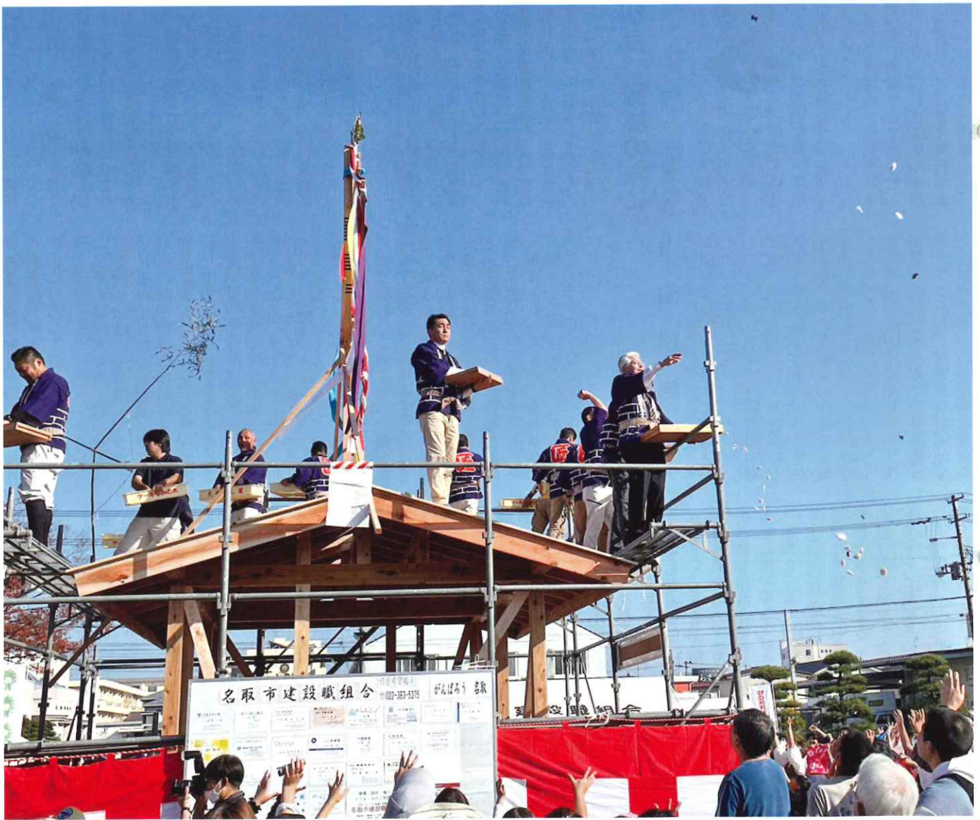
2023 ふるさと名取秋まつり