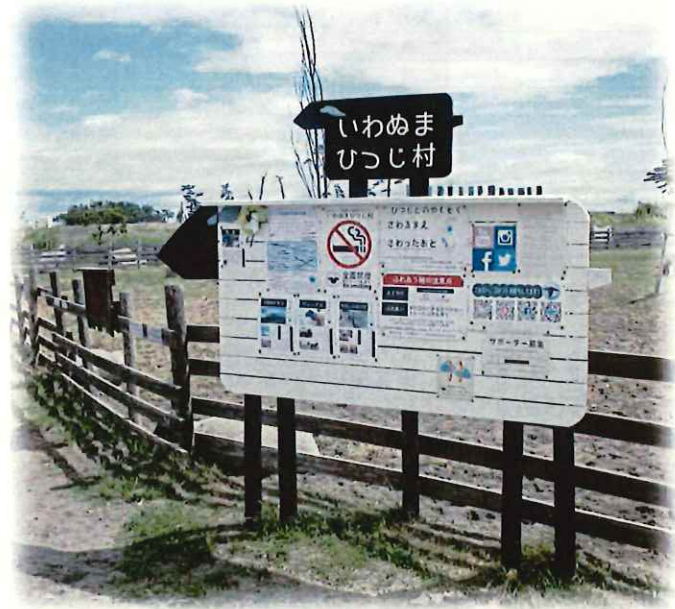
いわぬまひつじ村