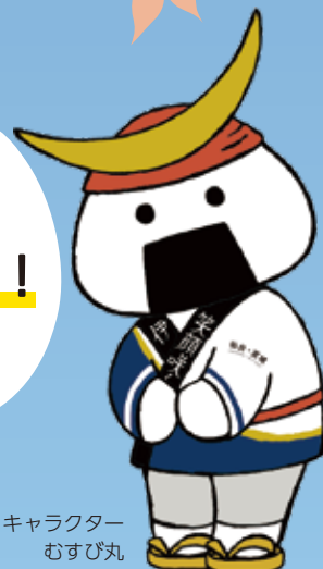
仙台・宮城観光PRキャラクター むすび丸

沿岸部エリア (気仙沼市、南三陸町、石巻市、女川町、東松島市、松島町、利府町、塩釜市、七ヶ浜町、多賀城市、仙台市(宮城野区、若林区及び太白区に限る)、名取市、岩沼市、亶理町及び山元町)