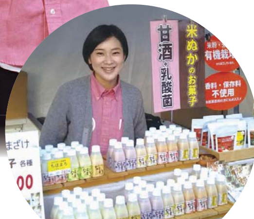
高千穂ムラたび協議会 (宮崎県高千穂町) (第3回選定地区)