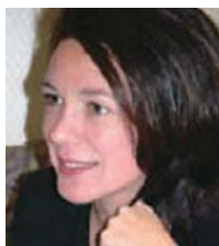
あん・まくどなるど 上智大学大学院教授 慶応義塾大学特任教授