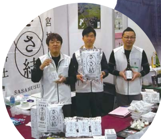
大崎の米『ささ結』ブランドコンソーシアム (宮城県大崎市) (第5回選定地区)